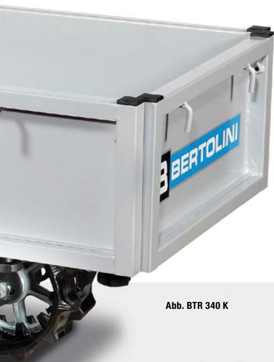
Abb. BTR 340 K