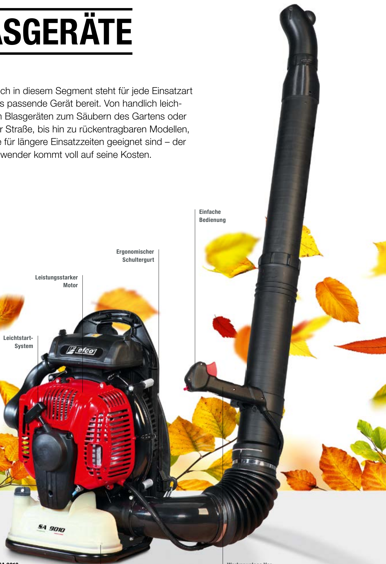
Abb. SA 9010

Auch in diesem Segment steht für jede Einsatzart das passende Gerät bereit. Von handlich leichten Blasgeräten zum Säubern des Gartens oder der Straße, bis hin zu rückertragbaren Modellen, die für längere Einsatzzeiten geeignet sind – der Anwender kommt voll auf seine Kosten.