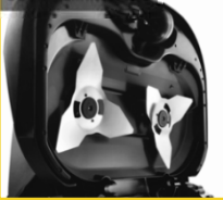
56 cm Schnittbreite

Kantennahes Mähen Zeitraubendes Nacharbeiten entfällt