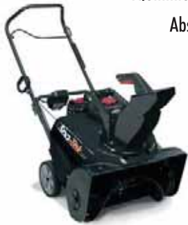
Sno-Tek SS 22 E

Die zweistufigen Schneefräsen von Sno-Tek sind die idealen Einstiegsgeräte mit unschlagbarem Preis-Leistungsverhältnis. Sie verfügen über das neue wartungsfreundliche „Top-Load“ Aluminiumgetriebe und liefern durch eine optimale Abstimmung zwischen Motor und Räumbreite ein stets sauberes Räumergebnis. Die einstufige SS 22 E ist besonders leicht, kompakt und ideal für kleinere Räumflächen geeignet.