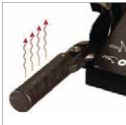
Nachrüstset Griffheizung (für Deluxe Modelle)

Praktisches Zubehör für Ihre Sno-Tek und Ariens Fräse: