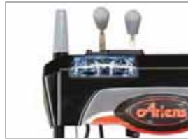
Halogenscheinwerfer: Sicheres Arbeiten auch bei Dunkelheit