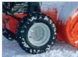
Automatische Differentialsperre für mehr Komfort und beste Traction (DLE-Modelle)