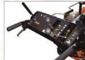
Einfache und komfortable Bedienung