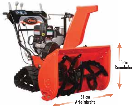
Ariens ST 24 LET

Alle Ariens Modelle präsentieren sich in dieser Saison mit ergonomischen Verbesserungen in einem neuen ansprechenden Design. Außerdem verfügen Sie über das neue wartungsfreundliche „Top-Load“ Getriebe aus Guss. Viele praktische Ausstattungsdetails sorgen je nach Modell für komfortable Handhabung und beste Räumleistung.