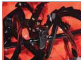
Robustes und wartungsfreundliches Gussgetriebe