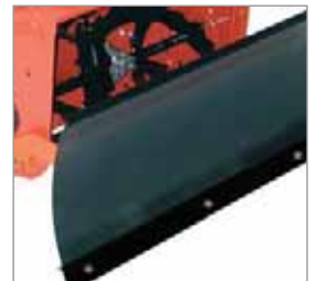
Universal Kunststoff-Schneeschild: Räumbreite 100 cm, passend für alle Ariens Fräsen sowie Sno-Tek ST 24 E

(Weiteres Zubehör auf Anfrage erhältlich)