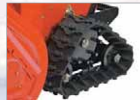
Breite und griffige Raupen