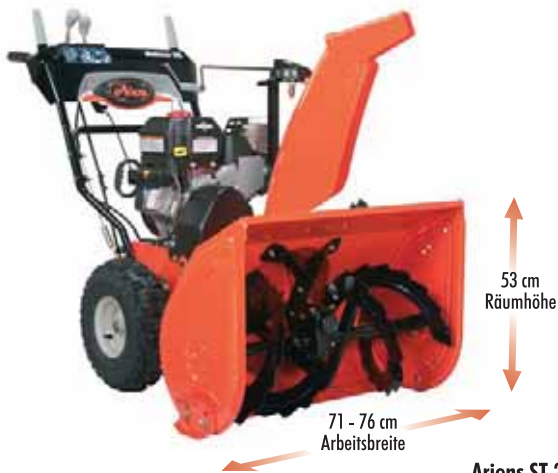
Ariens ST 28 DLE