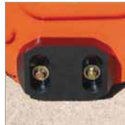
Laufsole Kunststoff (Set mit 2 Stück)